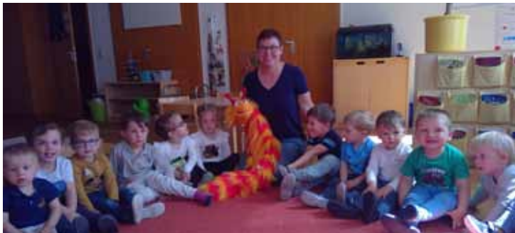
Besuch aus der Bücherei