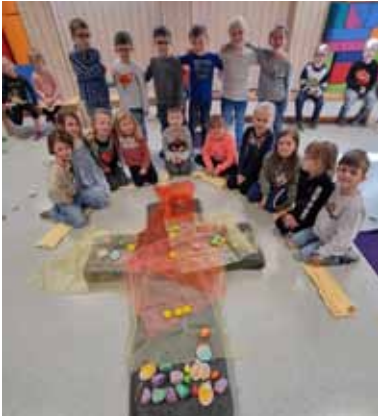
Osterfeier – „Jesus lebt!“