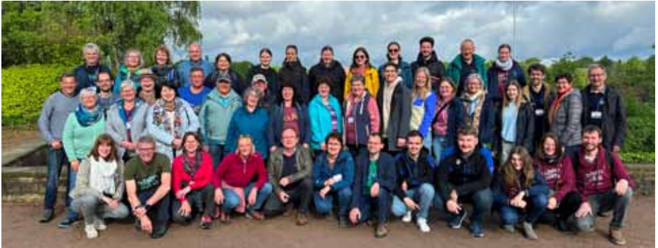
Die Gruppe des evang. Posaunenchores Floß und Freunde beim Deutschen Posaunentag in Hamburg. 17 000 Bläserinnen und Bläser waren anwesend.