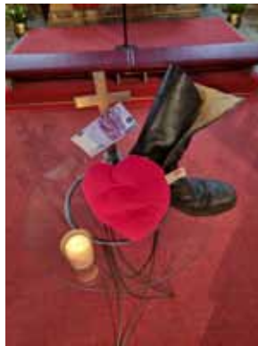
Falschgeld, ausgelatschte Schuhe und ein Herz voller Liebe.