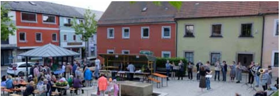
Musikalische Muttertagsgrüße bei der Blumentombola des OWV.