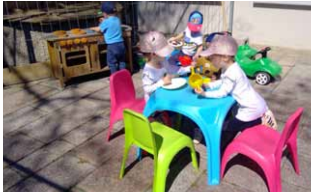
Gemeindehaus in Kinderhand