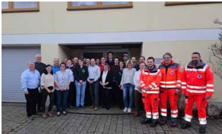
Erinnerungen im Fotoalbum