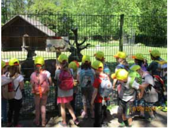
Im Wildpark in Teublitz