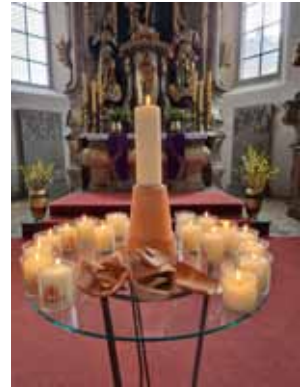
Auch meine „Scherben“ bringe ich Gott.