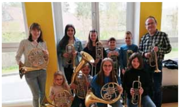
Kinder und Jugendliche üben fleißig mit ihren Instrumenten.