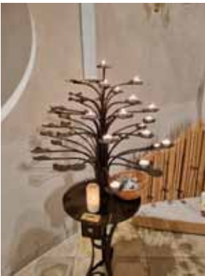
Konfi-Gabe 2024: Lichterbaum